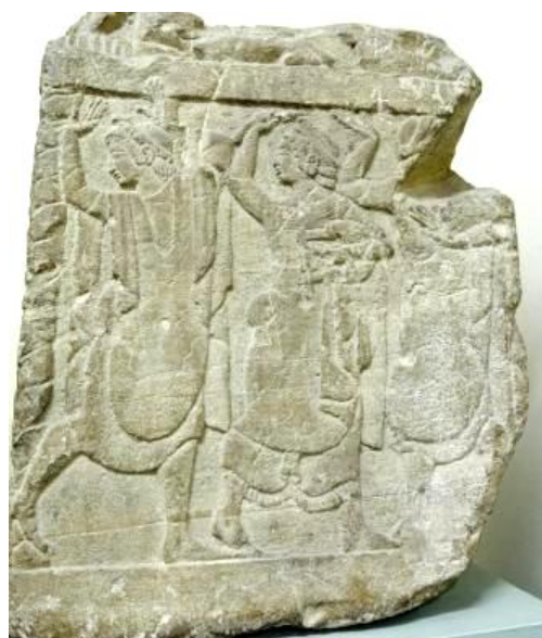
"Dance like an Etruscan" (sur un air des années '80) Danseurs et musiciens étrusques Museo archeologico di Perugia